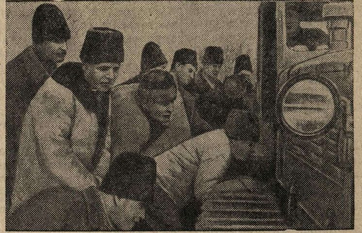
Колхозники недавно организованного колхоза «Новая жизнь» (село Кыцканы, Бендерский уезд) осматривают первый трактор, прибывший для обслуживания весенне-посевной кампании.

Каждый день в Молдавскую ССР прибывают десятки новых тракторов.