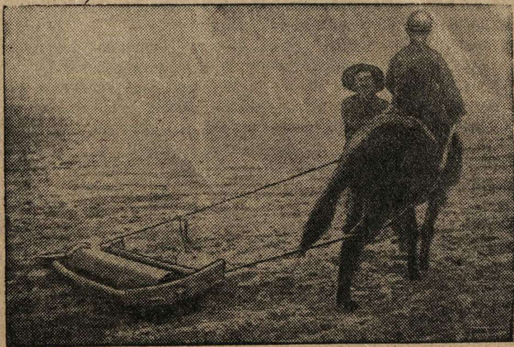
Манчжурский крестьянин на весенних полевых работах