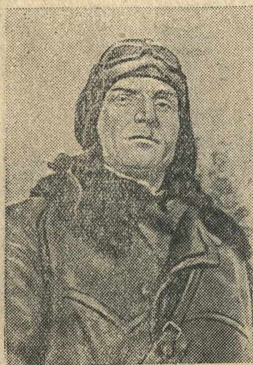
Герой Советского Союза батальонный комиссар Г. А. Таряник.