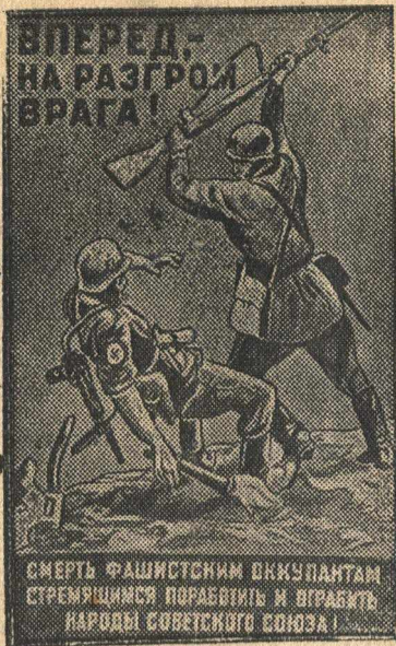
Плакат работы художника Д. Шмаринова, выпущенный издательством «Искусство»