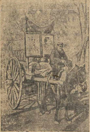
Колхозники сельхозартели имени Сталина (Ярмозарский сельсовет, Ферганский район) везут продукты рабочим из личных запасов.