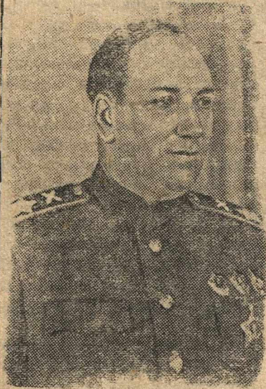
Маршал артиллерии Н. Н. ВОРОНОВ.

* Недалеко от гор. Туль (Франция) вольные стрелки совершили нападение на немецкий отряд. В завязавшей схватке убито и ранено 28 гитлеровцев. В Омикуре французские патриоты взорвали немецкий эшелон с военными материалами.