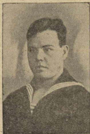
Краснофлотец. Ф. Н. Сироткин.