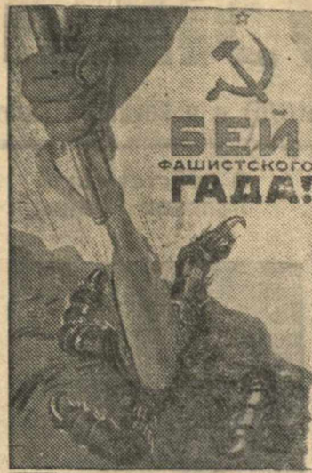
Рисунок художника Кокоркина

Советское информбюро располагает достоверными сведениями о том, что на болгаро-турецкой границе происходят большие передвижки войск. Днем и ночью, под руководством немецких инженеров, укрепляется граница, строятся десятки аэродромов. Фашистская военщина готовится, видимо, к захвату Босфорского пролива.