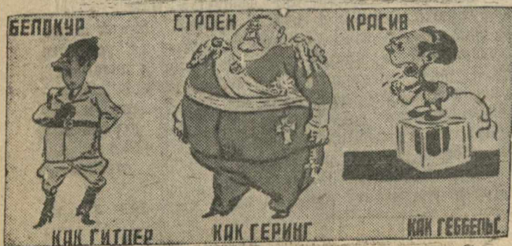
Рисунок Б. Ефимова (Окно ТАСС № 22).

Наглядное изображение „АРИЙСКОГО“ происхождения Согласно фашистской расовой теории истинный ариец должен быть: