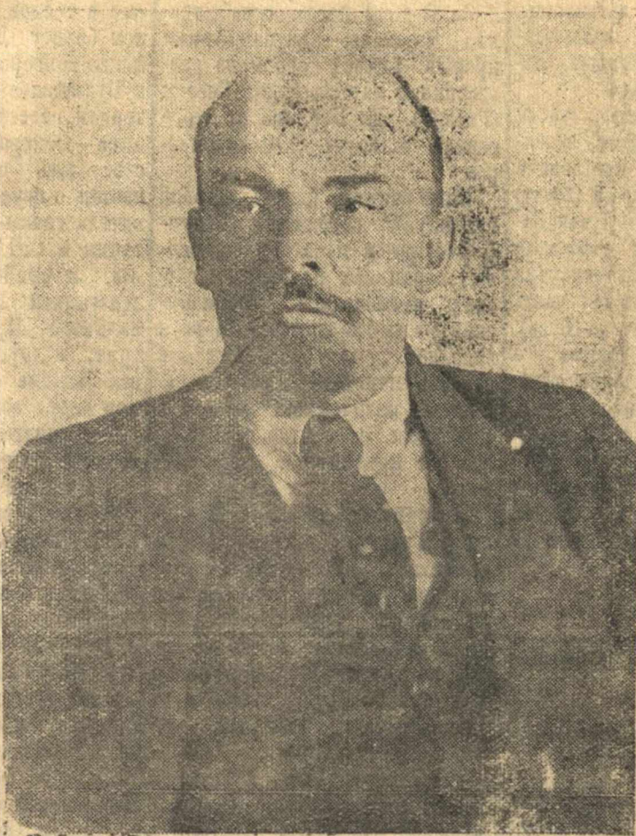
Владимир Ильич Ленин (1870—1924 г. г.)

21 год прошел с того дня, когда остановилось благородное сердце человека, которого миллионы людей называли своим отцом.