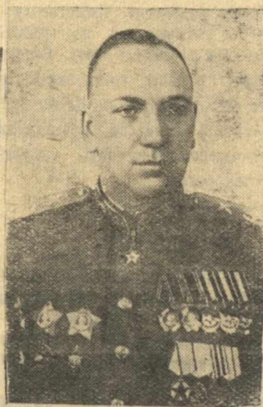
Главный Маршал артиллерии Николай Николаевич ВОРОНОВ.