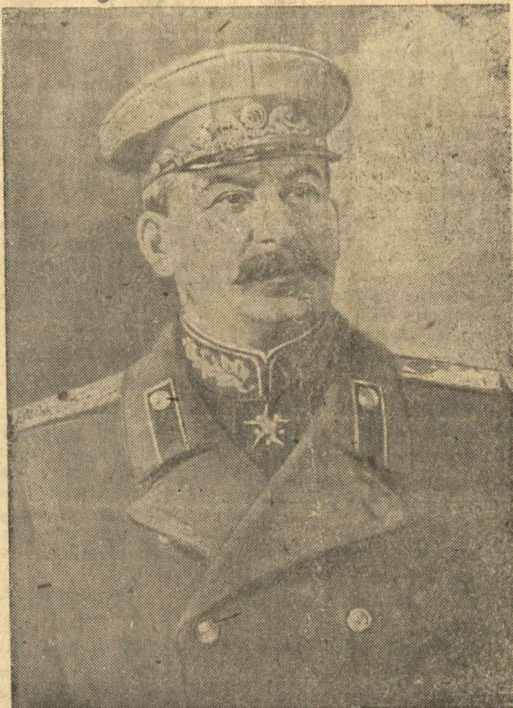
Верховный Главнокомандующий Генералиссимус Советского Союза И. В. Сталин.

Это означает, что южный Сахалин и Курильские острова отойдут к Советскому Союзу и отныне они будут служить не средством отрыва Советского Союза от океана и базой японского нападения на наш Дальний Восток, а средством прямой связи Советского Союза с океаном и базой обороны нашей страны от японской агрессии.