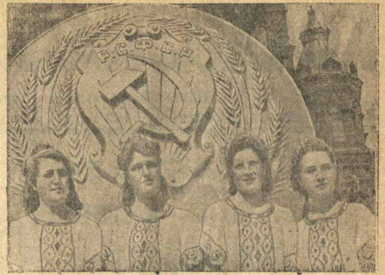
Всесоюзный парад физкультурников на Красной площади в Москве 12 августа 1945 года. На снимке: физкультурницы РСФСР.