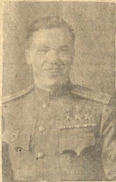
Трижды Герой Советского Союза гвардия майор Иван Никитич Кожедуб.

Священный долг каждого колхоза — с честью выполнить свои обязательства перед государством. К 20 октября по каждому колхозу выполним хлебопоставки!