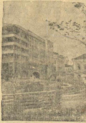
Иваново. Улицы 12 декабря. У здания новой гостиницы.