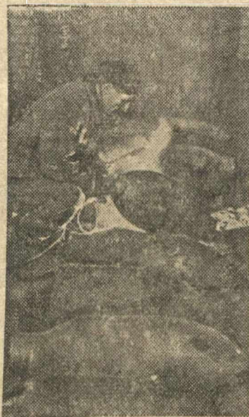
Отделка фугасных авиабомб на Н-ском заводе (Москва).