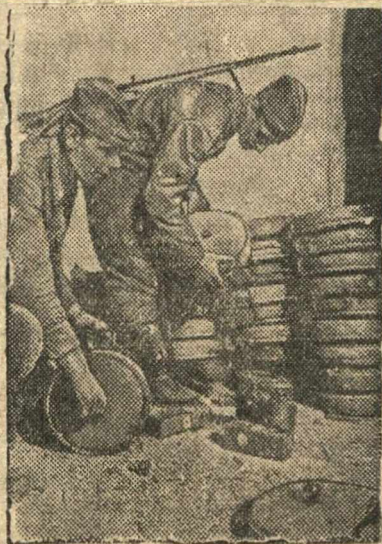
Минеры проверяют взрыватели немецких мин.

(Юго-Западный фронт) Бойцы инженерной части командира Филиппова, разминировав минные поля противника, собрали 520 противотанковых и противодетных немецких мин. Вражеские мины используются против фашистских захватчиков.