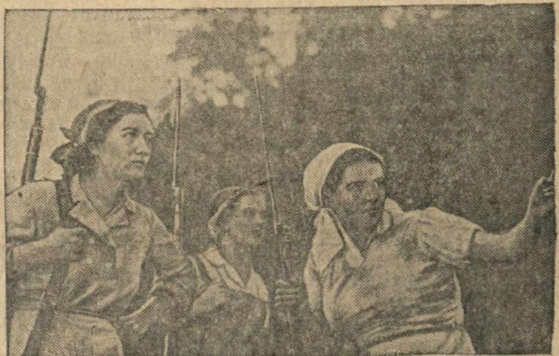
Партизанское движение стало грозной силой для фашистских разбойников. С каждым днем растет многочисленная армия вооруженных советских патриотов. Девушки-колхозницы села Н., вступившие в партизанский отряд. Справа—председатель сельского совета комсомолка тов. Н.

Чтобы хоть в какой-то мере восполнить острую нехватку продовольствия Гитлер беззастенчиво грабит своих союзников. Во многих сельскохозяйственных районах Италии немцы забрали почти все продовольствие. Итальянский народ голодает. На днях Гитлер вновь потребовал от Муссолини доставить крупную партию зерна. В связи с этим итальянский совет министров по настоянию Муссолини, сократил выдачу хлеба населению по карточкам до 200 граммов в день на человека. Итальянский народ с тревогой ожидает наступления голодной зимы.