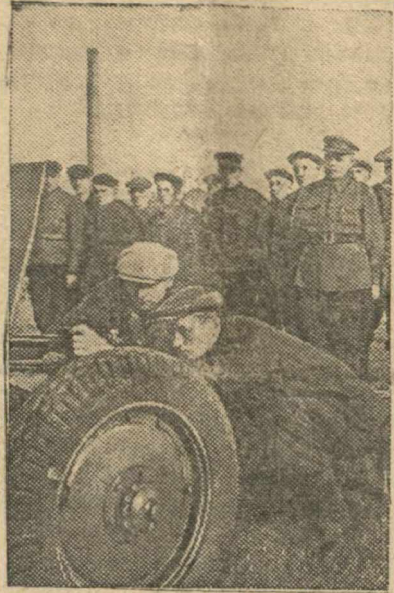
Героические защитники Ленинграда

Работники животноводства должны стать активными участниками предоктябрьского социалистического соревнования. Их долг—обеспечить новые успехи в развитии колхозного животноводства, выполнить планы комплектования ферм поголовьем скота, подготовить скоту сытую и теплую зимовку, бороться за рост продуктивности. Их долг—дать стране и Красной Армии больше мяса, молока, масла, шерсти и других продуктов. Их долг—обеспечить в годовщину Октября выполнение плана поставок животноводческих продуктов государству, по примеру передовиков—начать сдачу мяса государству за 1942 год.