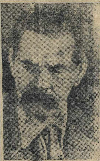
А. М. ГОРЬКИЙ. (75 лет со дня рождения А. М. Горького).