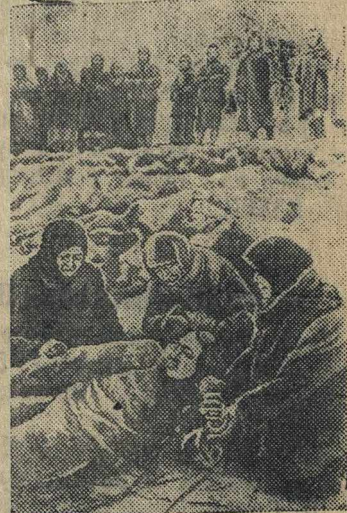
На снимке: Место расстрела за кирпичным заводом, где фашисты убили больше 200 человек.

Когда наши войска подходили к Пятигорску, немцы вывели за город под предлогом эвакуации в Германию несколько сот человек пленных советских бойцов и командиров и мирных жителей и расстреляли их из автоматов.