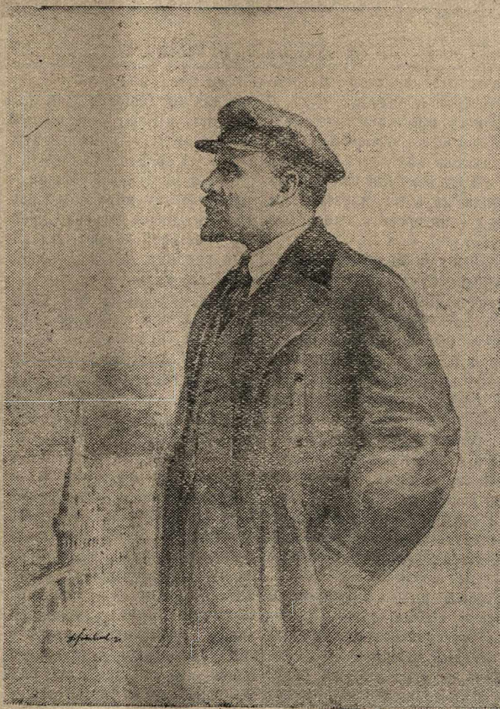
В. И. Ленин.

Сталин—это Ленин сегодня!—эти замечательные слова как нельзя ярче выражают думы и мысли всех советских людей. Под руководством Сталина народы Советского Союза идут от победы к победе, к торжеству коммунизма!