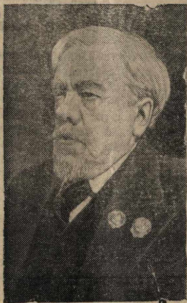
Герой Социалистического Труда академик Сергей Алексеевич Чаплыгин.