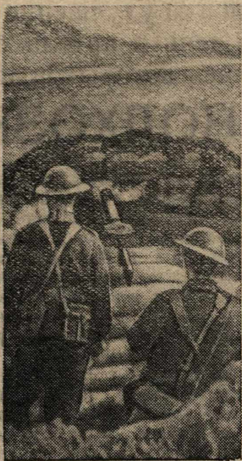
Пулеметное гнездо на одной из дорог в Англии.