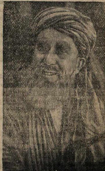
Заслуженный артист Таджикской ССР Бурхан Тураев в роли колхозного мельника (музыкальное представление «Лола» в постановке Таджикского Государственного театра оперы и балета, Сталинабад).

Весной 1941 г. в Москве будет проведена декада таджикского искусства. К декаде готовится ряд постановок: музыкальное представление «Лола», оперы «Восстание Восе» и «Кузнец Кюба», первый таджикский балет «Ду Голь», драма «Краснопалочники» и трагедия Шекспира «Отелло».