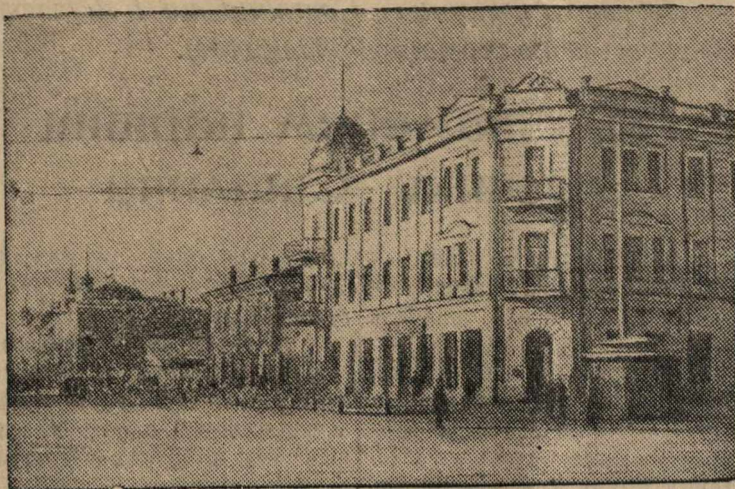
Улица Ленина в г. Благовещенске (Хабаровский край).