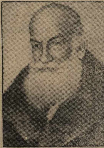
Н. Е. Жуковский.

17 марта исполнилось 20 лет со дня смерти ученого с мировым именем «отца русской авиации» Н. Е. Жуковского — основателя Военно-Воздушной Академии в Москве.