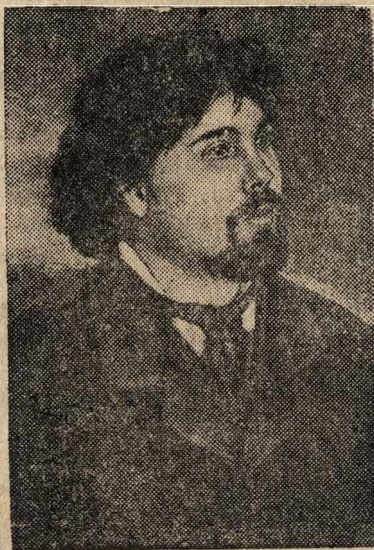
В. И. Суриков (с портрета художника П. Е. Репина, 1887 г.).

К 25-летию со дня смерти (19 марта 1916 г.) знаменитого русского художника В. И. Сурикова.