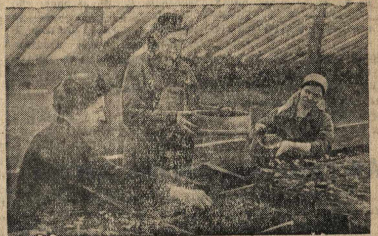
Пикировка томатов для высадки в парники.

Колхоз «Заветы Ильича» (Красногорский район, Московская область) за успешную работу в 1940 году получил районное переходящее красное знамя. В 1941 году колхоз построил новую теплицу площадью 250 кв. метров, в которой выращиваются на зелень лук, петрушка и свекла.