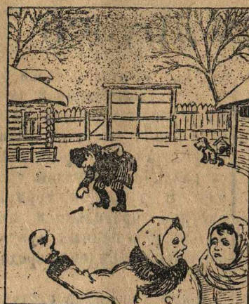
Рисунок Б. Афилова

— Мой-то хозяйственный какой: каждый гвоздик у себя на дворе подберет.