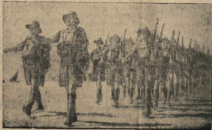
Английские войска на фронте в Западной пустыне (Африка).