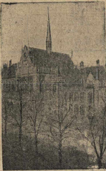
Здание Академии художеств Латвийской ССР в г. Риге.