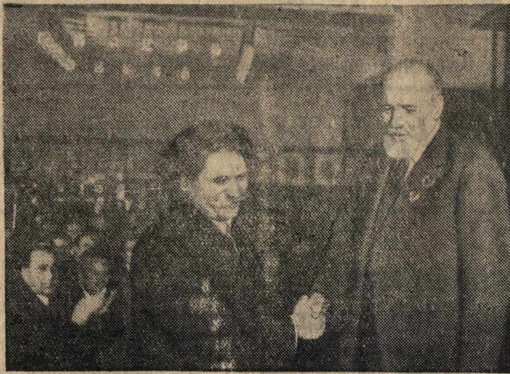
Председатель Комитета по Сталинским премиям в области литературы и искусства В. П. Немирович-Данченко поздравляет писателя С. Н. Сергеева-Ценского.

21 и 22 апреля в Москве состоялось вручение дипломов и денежных премий лауреатам Сталинской премии—деятелям науки, изобретательства и литературы.