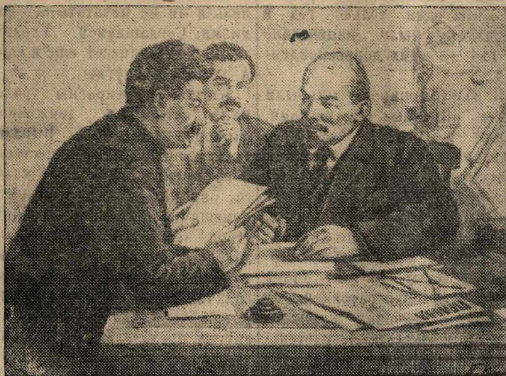
В. И. Ленин, Н. В. Сталин и В. М. Молотов в редакции газеты «Правда» — 1917 г.

Сегодня, — 5 мая — День Большевистской Печати