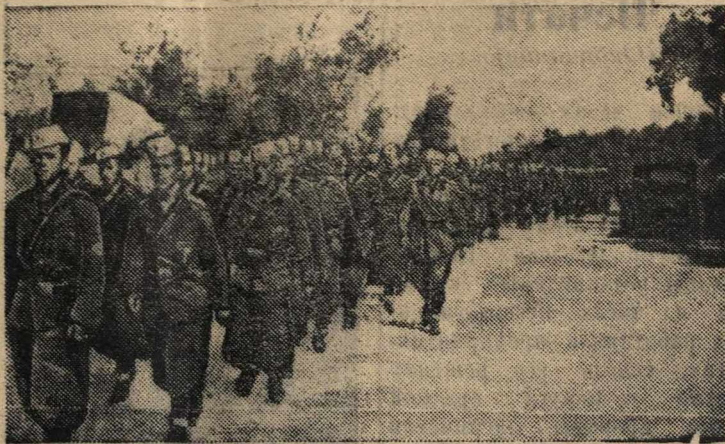
Итальянские войска в Албании.