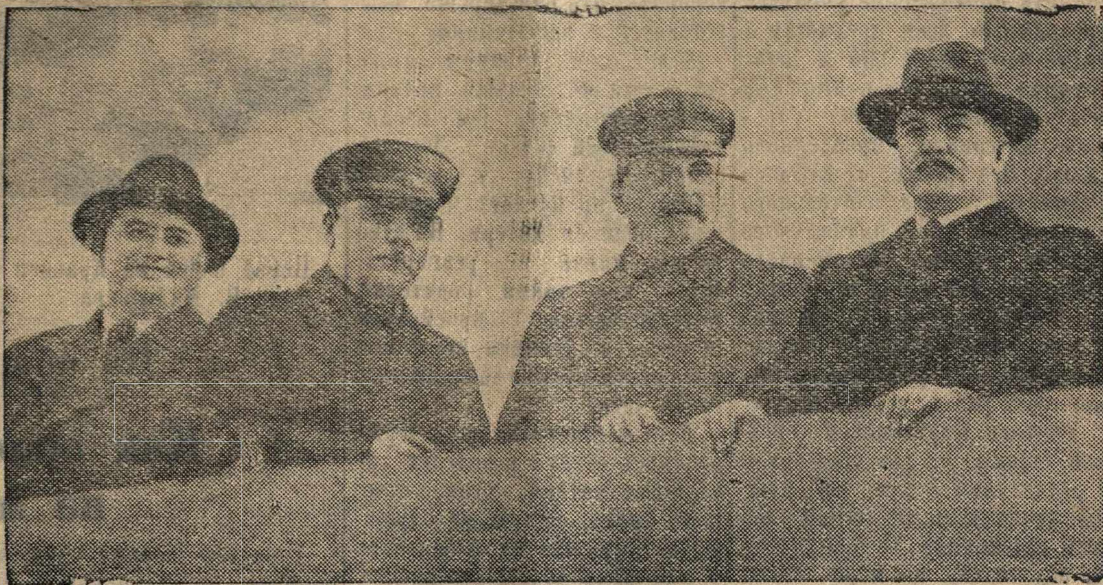
Справа налево: товарищи В. М. Молотов, И. В. Сталин, К. Е. Ворошилов, и Г. М. Димитров на трибуне мавзолея.