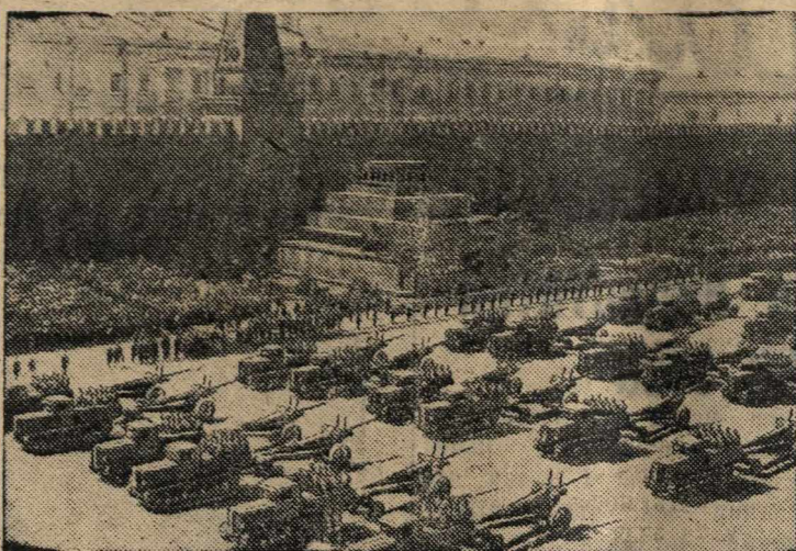
Парад войск на Красной площади. Артиллерия на параде.