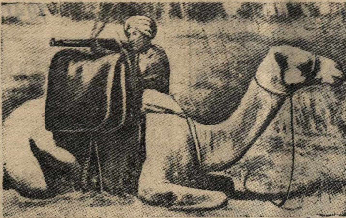
Верблюжий дозор суданских войск на эритрейской границе.