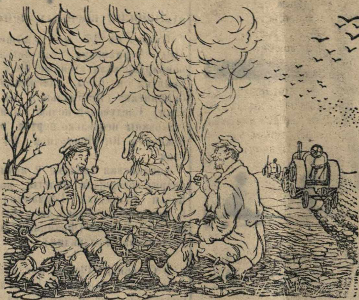
Много дыму, да мало пылу. Рисунок К. Тесдорвича

В отдельных тракторных отрядах весьма много простаивают тракторы. Где трактористы устраивают частные, причем долгие перекурки, а в колхозе «Трудовик» трактористы очень поздно выезжают на работу. (см. замечку ниже).