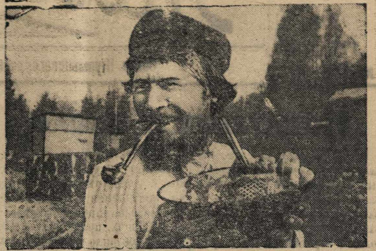
Репродукция из альбома «Смотр побед сельскохозяйственного хозяйства», выпущенного изд-вом «Сельхозгиз», фото А. Скурихина.

На пасеке колхоза имени Крупской, Ибресинского района, Чувашской АССР.