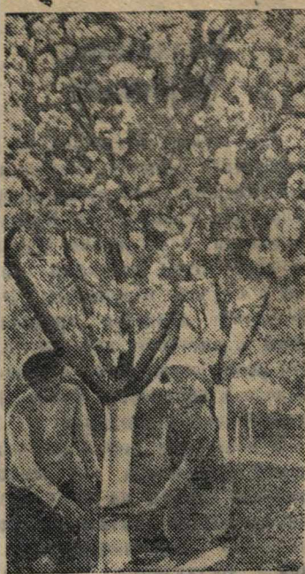
Установка клеевых колец в фруктовом саду плодово-ягодного совхоза № 4 треста пригородных хозяйств при Кишиневском горисполкоме.