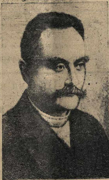
И. Я. Франко.

28 мая исполняется 25 лет со дня смерти выдающегося украинского писателя и ученого И. Я. Франко.