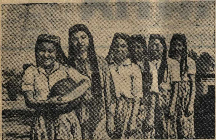
Женская волейбольная команда колхоза.

Колхоз имени Буденного Илбаскентского района, Андижанской области, Узбекской ССР — участник Всесоюзной сельскохозяйственной выставки 1941 г. по физкультурной работе.