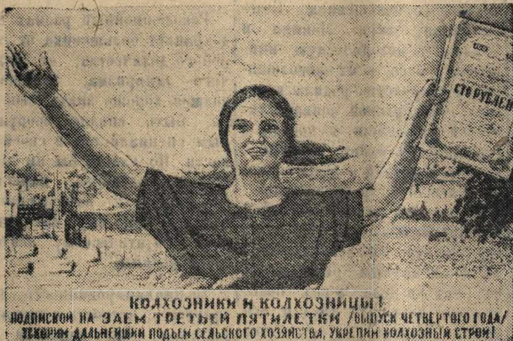
КОЛХОЗНИКИ И КОЛХОЗНИЦЫ! ПОДПИСКИ НА ЗАЕМ ТРЕТЬЕЙ ПЯТИЛЕТКИ (ВЫПУСК ЧЕТВЕРТОГО ГОДА) УКРЕПЛЯЮТ ДАЛЬНЕЙШИЙ ПОДЪЕМ СЕЛЬСКОГО ХОЗЯЙСТВА, УКРЕПЛЯЮТ КОЛХОЗНЫЙ СТРОИТЕЛЬСТВО