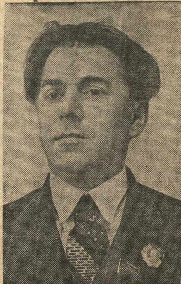
Украинский поэт-орденоносец, депутат Верховного Совета УССР Павло Тычина.

К 50-летию со дня рождения украинского поэта Павло Тычина