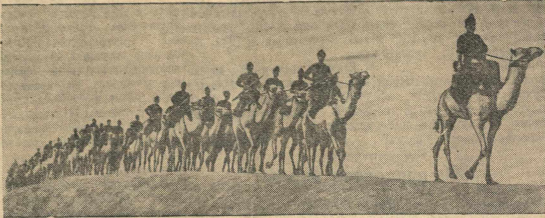
Тренировочные учения египетских войск в условиях пустыни.

Американская газета «Нью-Йорк таймс» пишет, что в неоккупированной зоне Франции находится еще 150 тысяч испанских беженцев, которые отказываются возвратиться в Испанию. Газета указывает, что французское правительство недавно дало согласие на выезд испанских беженцев в Мексику, однако отсутствие транспорта препятствует их выезду.