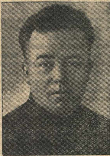
Секретарь Горьковского обкома и горкома ВКП(б) тов. Михаил Иванович РОДИОНОВ , выдвинут кандидатом в депутаты Совета Союза Верховного Совета СССР по Горьковскому Ленинскому избирательному округу № 116.