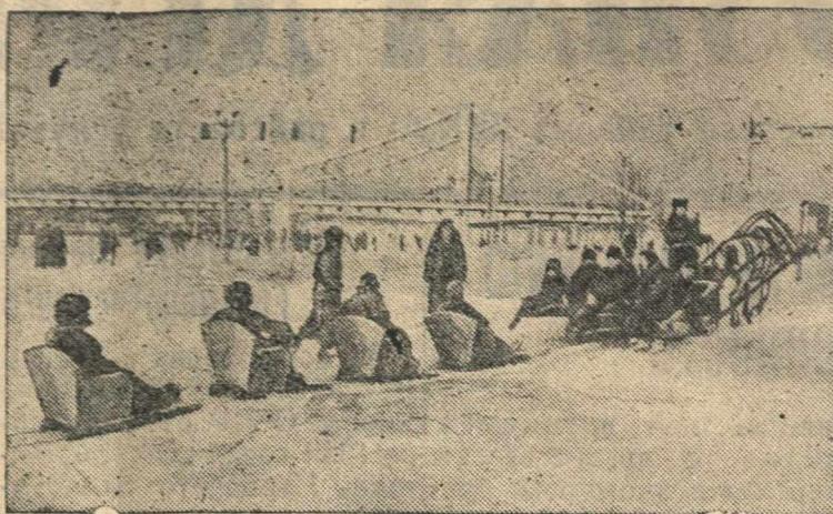
Катание детей на санях.

В Центральном парке культуры и отдыха имени М. Горького (Москва).