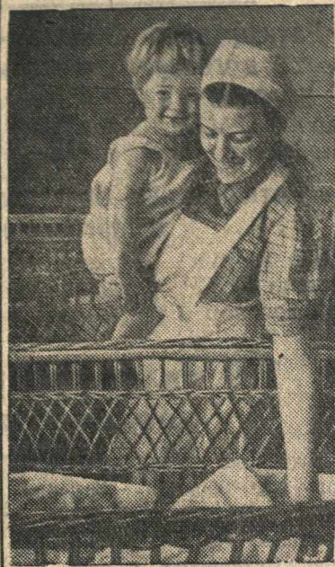
В новых детских яслях № 1 в г. Каунасе.

С установлением Советской власти в Литве введено социальное страхование, бесплатная медицинская помощь. Открываются десятки новых детских яслей, детсадов, поликлиник, амбулаторий, родильных домов и т. д.