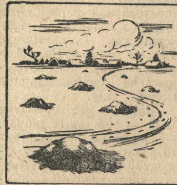
Как не надо складывать навоз в поле.

После укладки навоза в штабеля на полную высоту важно прикрыть его слоем торфа в 10—20 см., соломой или еще лучше—соломенной резкой. Покрышка предохраняет навоз от потерь аммиака и от замерзания, а это обеспечивает быстрое и правильное созревание навоза.