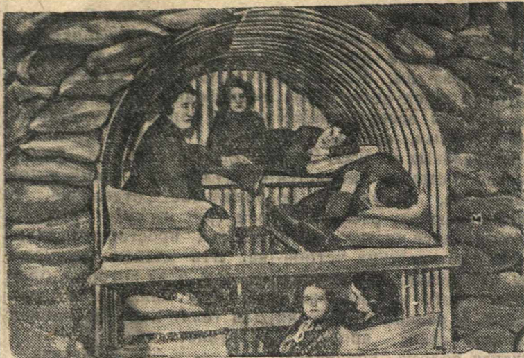
Внутренний вид бомбоубежища Андерсона в Англии.