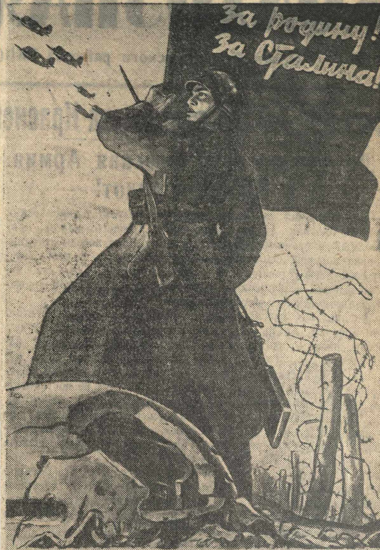
СЛАВА ГЕРОИЧЕСКОЙ КРАСНОЙ АРМИИ

Рисунок художника В. Иванова (Репродукция с плаката изд. «Искусство»).