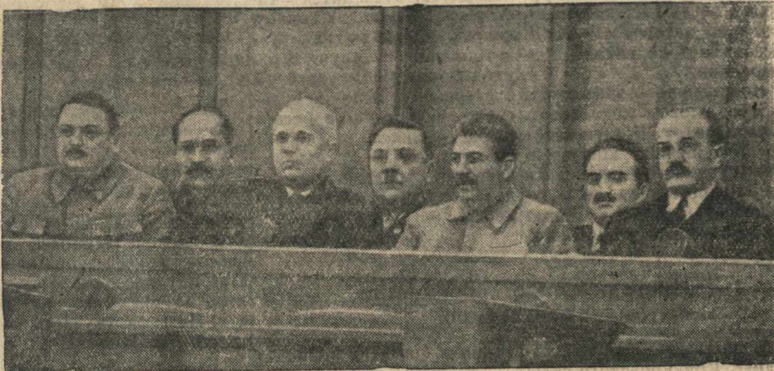
Руководители партии и правительства на совместном заседании Совета Союза и Совета Национальностей. Справа налево: товарищи В. М. Молотов, А. И. Микоян, И. В. Сталин, К. Е. Ворошилов, Н. С. Хрущев, Л. М. Каганович и А. А. Жданов.