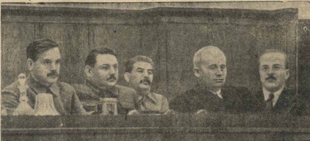
Товарищи А. А. Андреев, А. А. Жланов, И. В. Сталин, Н. С. Хрущев и В. М. Молотов в президиуме XVIII Всесоюзной конференции ВКП(б)

Партийным организациям колхозов, сельсоветам и правлениям колхозов нужно твердо держать в своих руках вопросы приема и сохранения молодняка с тем, чтобы более умело использовать имеющиеся возможности для более быстрого роста общественного животноводства в колхозах.